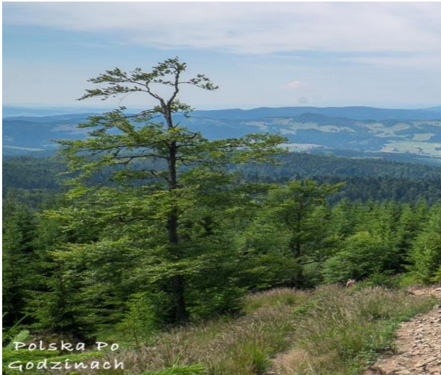
Widok ze szlaku w Beskidzie Sądeckim