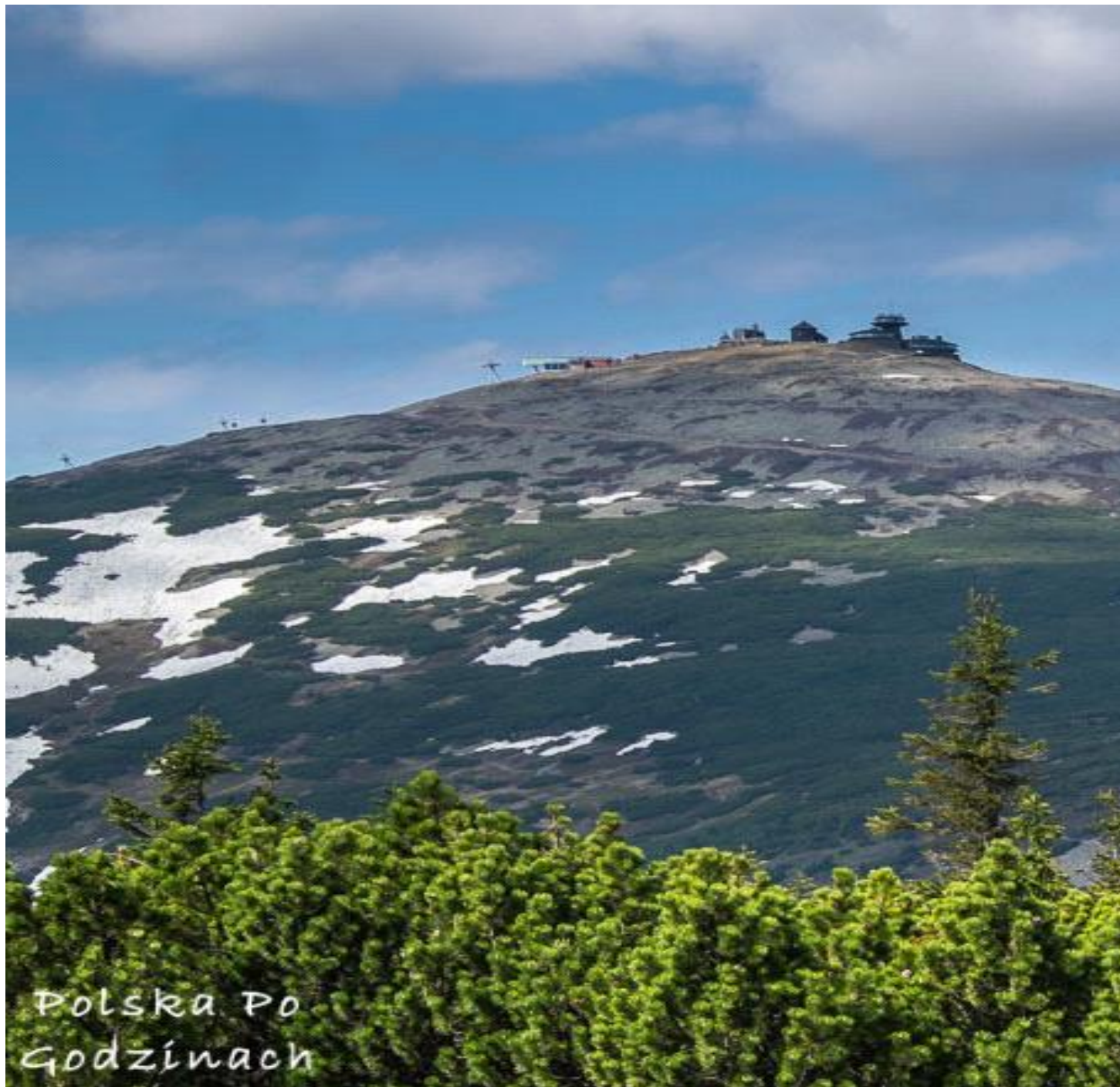
Śnieżka z charakterystycznym obserwatorium astronomicznym to symbol Karkonoszy.