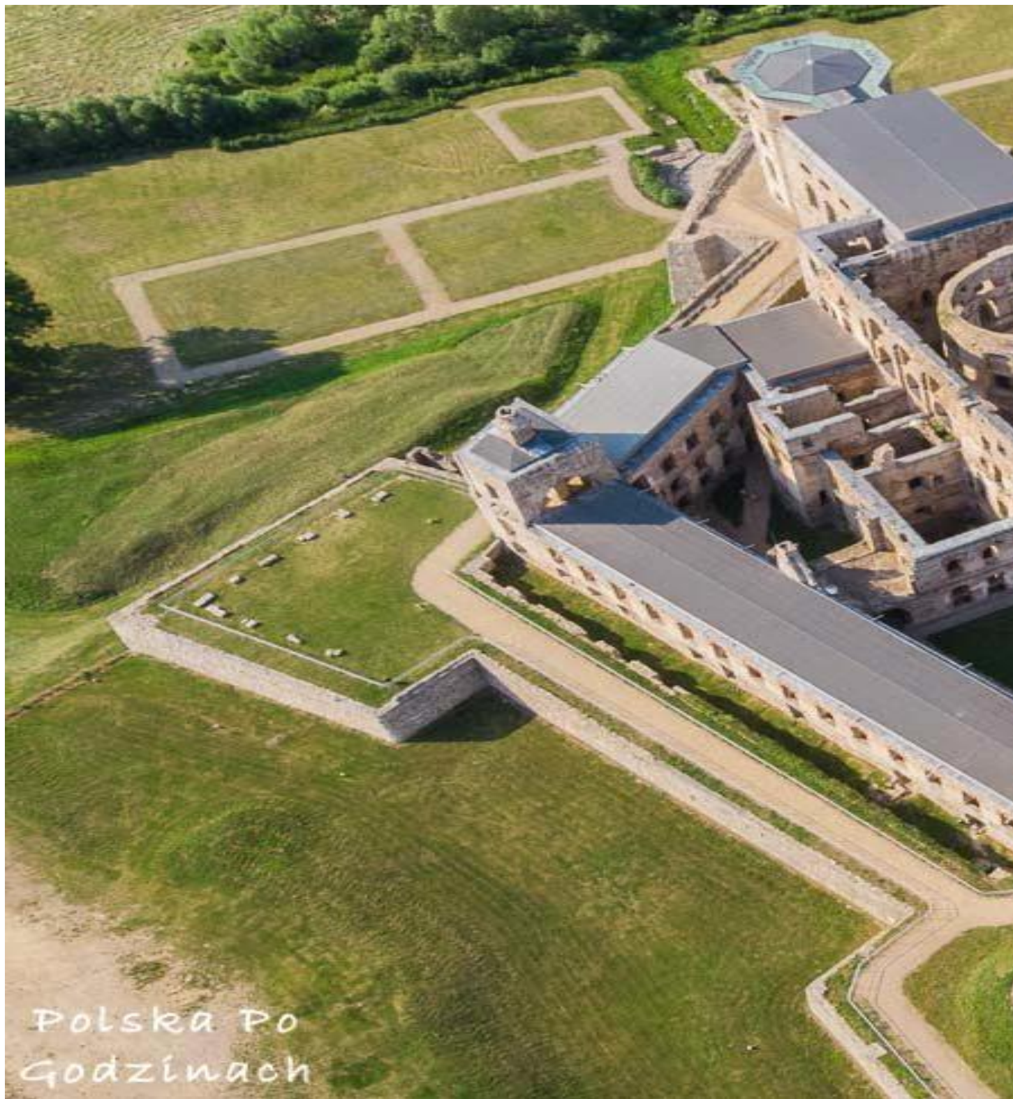
Zamek Krzyżtopór z lotu ptaka. Robi wrażenie?