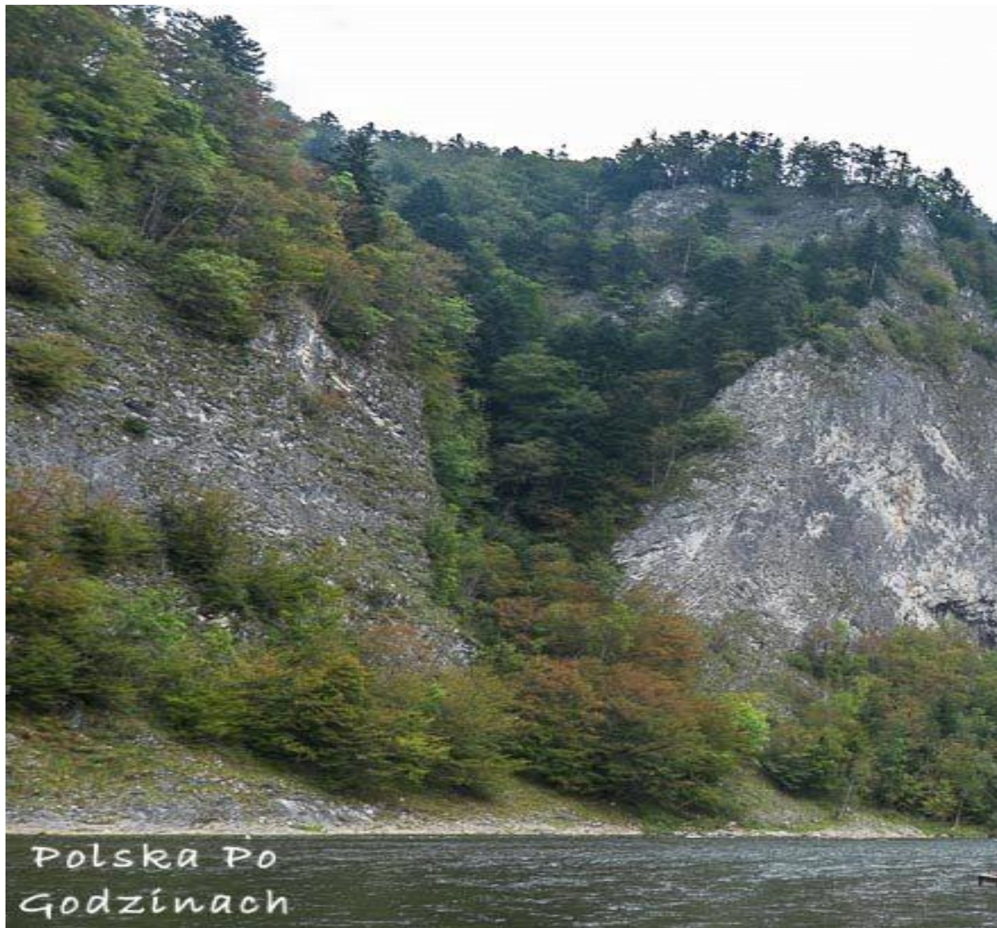
Polska Po Godzinach Spływ Dunajcem to jedna z popularniejszych atrakcji w Pieninach

ciągnących się wzdłuż granicy ze Słowacją. Nie boisz się wody? Musisz spróbować spływu Dunajcem! Z kolei poszukującym tajemniczych historii polecamy odwiedzić zamki nad zalewem Czorsztyńskim.