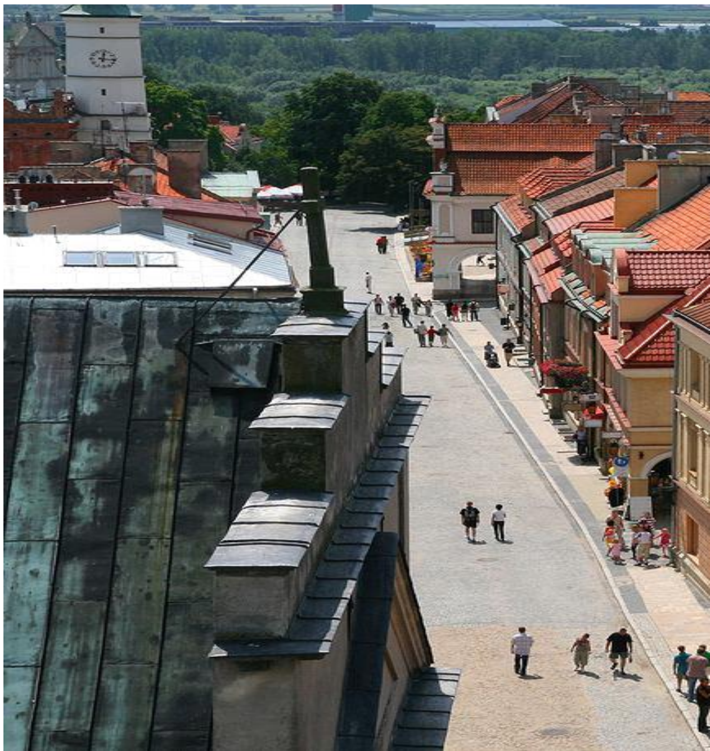
Sandomierz, Polska. Sandomierz położony malowniczo na siedmiu wzgórzach nad Wisłą porównywany jest czasem do Rzymu. To jedno z najstarszych polskich miast. Można tu podziwiać ponad sto zabytków, będących świadectwem